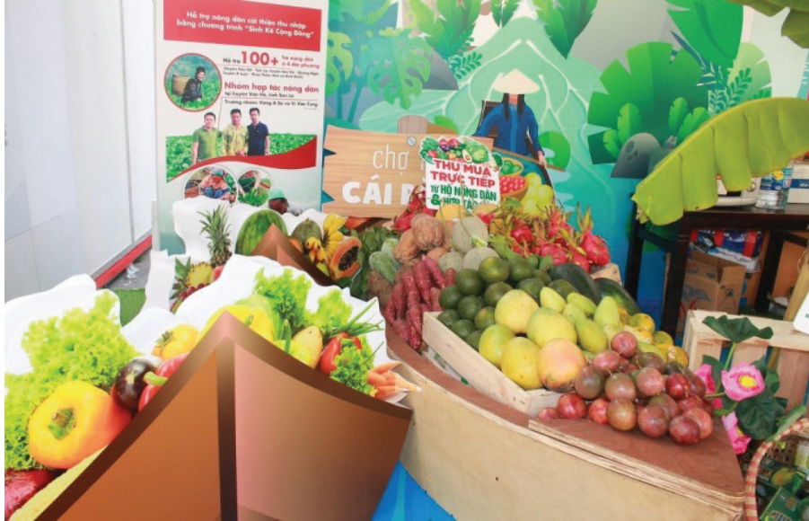
Sản phẩm được trưng bày tại Hội nghị toàn quốc Tổng kết 10 năm Chương trình MTQG xây dựng NTM giai đoạn 2010-2020.

xây dựng NTM đến nay, cả nước đã hoàn thành khối lượng đường giao thông nông thôn hơn gấp 5 lần của giai đoạn 2001-2010, 99,4% tổng số xã trên cả nước có đường ô tô đến trung tâm xã.